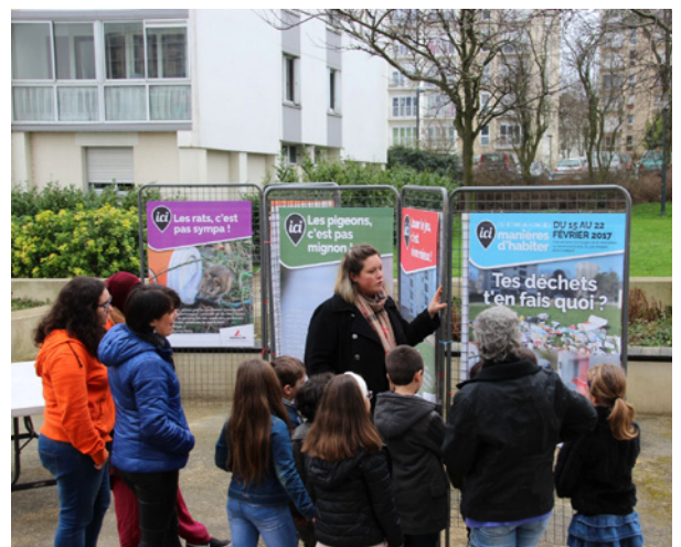
Une série d'affiches thématiques a été créée pour l'occasion

■ Amélie Lemaitre / Service communication