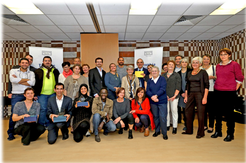
Trophée de l'Utilité Sociale – Edition 2015

13 h 15 – Annonce des lauréats et collation en salle « Provence ».